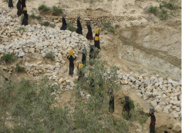
نساء قرية الغنايبس (حجة) يعملن في برنامج النقد مقابل العمل

وفي إطار الشراكة مع الجهات العاملة في نفس المجال، تم عقد ورشة عمل مع برنامج الغذاء العالمي بهدف اطلاع الأخير على آلية عمل برنامج النقد مقابل العمل والاستفادة منها، وكذلك بحث مدى إمكانية التنسيق مع البرنامج في تنفيذ أعمال