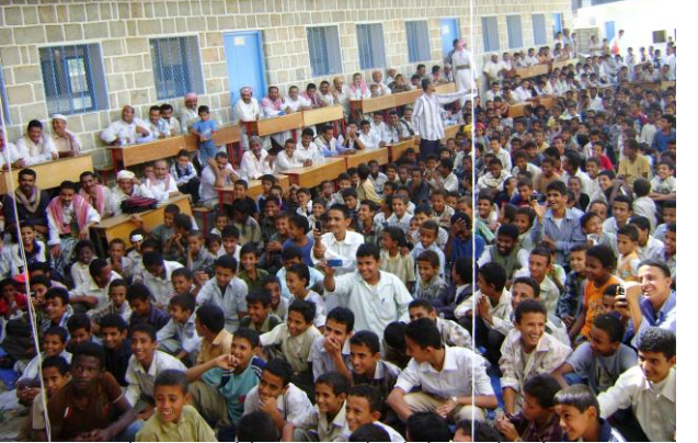
جانب من أنشطة التوعية بأهمية التعليم (عزلة أساود -ماوية – تعز)

التدخلات في محو الأمية: اختتمت الدورات التأهيلية المنعقدة لمدة تسعة شهور لمعلمات محو الأمية في عزلتيّ بني معانس (ذمار) والخضم (ريمة) بتنفيذ دورة تدريب أساسي للمعلمات الجدد، وذلك في فترة امتدت من ٣ فبراير وحتى نهاية شهر مارس ٢٠١١. وكان الهدف الرئيس هو رفع قدرات المشاركات في اللغة العربية والرياضيات حتى يتمكنّ من إدارة فصول محو الأمية في المناطق المستهدفة. كما تم إنتاج الدليل الإرشادي لإقامة حملات التوعية في مجال محو الأمية وتعليم الفتاة.